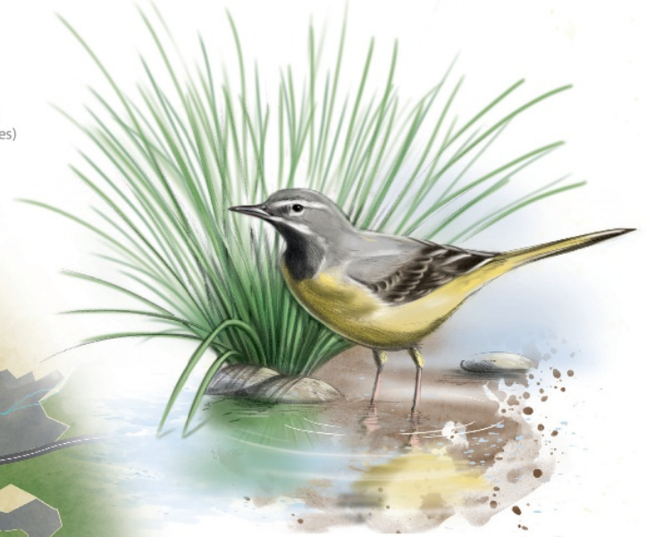
Gebirgsstelze Bergeronnette des ruisseaux Grey wagtail