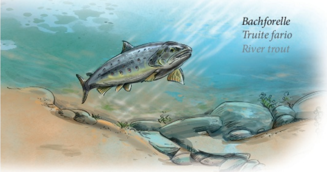
Bachforelle Truite fario River trout

+ Au cours d'un circuit à vélo d'environ 40 km au coeur de la Région des Trois Pays France - Allemagne - Suisse, vous pourrez découvrir sur 11 stations les habitats naturels du Rhin et de sa région et les espèces animales et végétales qui y vivent.