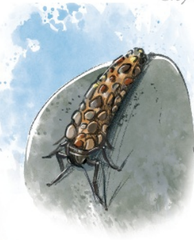
Köcherfliege Phrygane Caddisfly

🇨🇭 Tipp zur Orientierung: Folgen Sie den Signalen auf der Strecke: