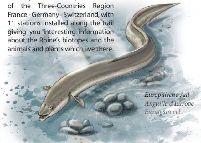
Europäische Aal Anguille d'Europe European eel

+ We propose a bicycle tour of about 40 km (about 20 miles) in the heart of the Three-Countries Region France - Germany - Switzerland, with 11 stations installed along the trail giving you interesting information about the Rhine's biotopes and the animals and plants which live there.